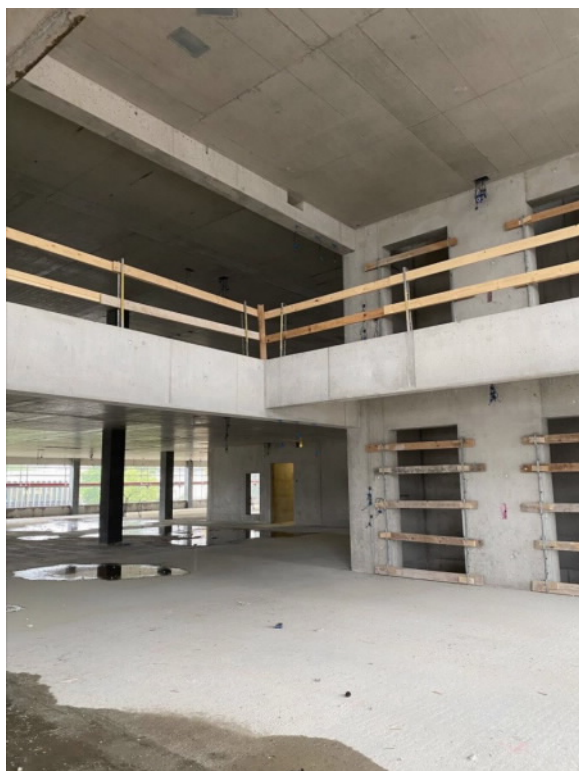
Das entstehende Gartenzimmer im 4./5. Stockwerk