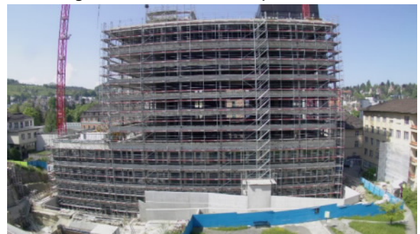
Das Kispi ist auf geplanter Bauhöhe angelangt...

Im ersten Untergeschoss sind die Bodenheizungen und Elektrokanäle in den Böden verlegt und werden mit dem Unterlagsboden vergossen. Wir möchten uns an dieser Stelle bei allen Beteiligten ganz herzlich bedanken für das nicht selbstverständliche riesige Interesse und Engagement bei der gemeinsamen Entwicklung des besten Kinderspitals!