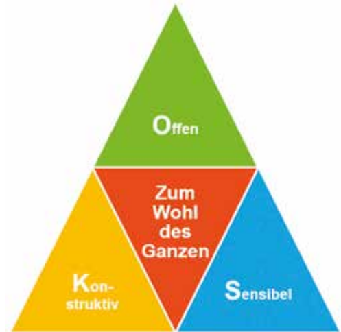
Die Kultur im OKS

Während 365 Tagen und rund um die Uhr tragen die Mitarbeiterinnen und Mitarbeiter ihren Teil dazu bei, dass die Strategie umgesetzt werden kann und der betriebliche Alltag innerhalb der festgelegten Organisation läuft. Sie leben die Kultur, beleben sie mit ihrer Persönlichkeit und prägen sie mit ihrer Haltung. Der Dank für diese Leistungen ist gekoppelt mit der Ermunterung, die Spitalleitung auch weiterhin bei der Bewirtschaftung des «magischen Dreiecks» zu unterstützen.