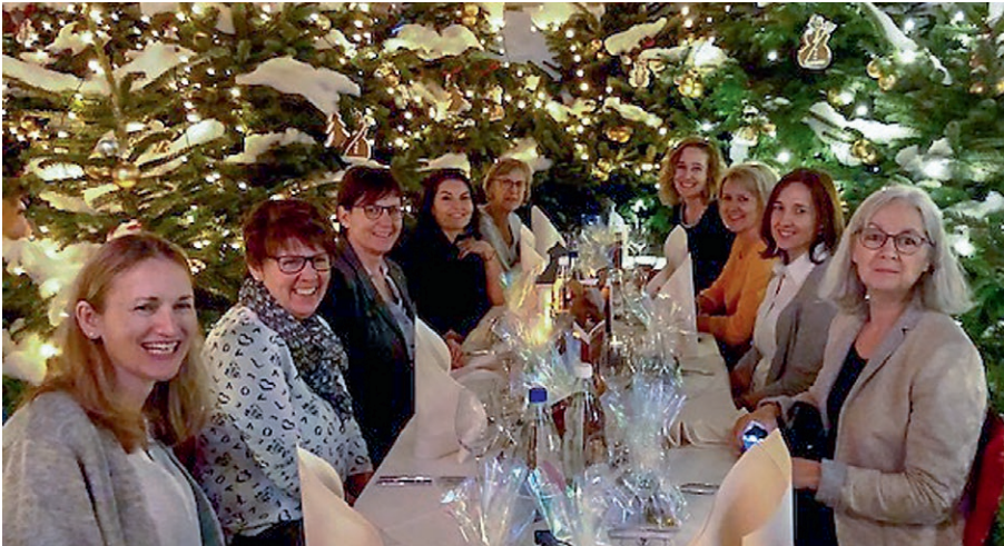
Am Weihnachtsanlass mit unseren freiwilligen Mitarbeiterinnen.